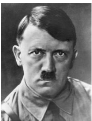
Figuur 2: Adolf Hitler

1933: Adolf Hitler is vandaag verkozen tot rijkskanselier. Hij kwam op voor de nationaal-socialistische Duitse arbeiderspartij