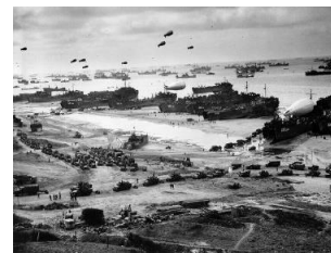
Figuur 3: D-Day 6 juni 1944

Op 6 juni 1944 hebben de geallieerde troepen een groot offensief ingezet. Hiermee hopen ze het Duitse rijk definitief onder de voet te lopen. De Duitsers proberen wanhopig weerstand te bieden. Zo hebben de Duitsers op 16 september 1944 het Ardennenoffensief ingezet.