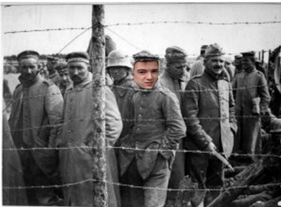
Jv leiding gevangen genomen door Noorse troepen